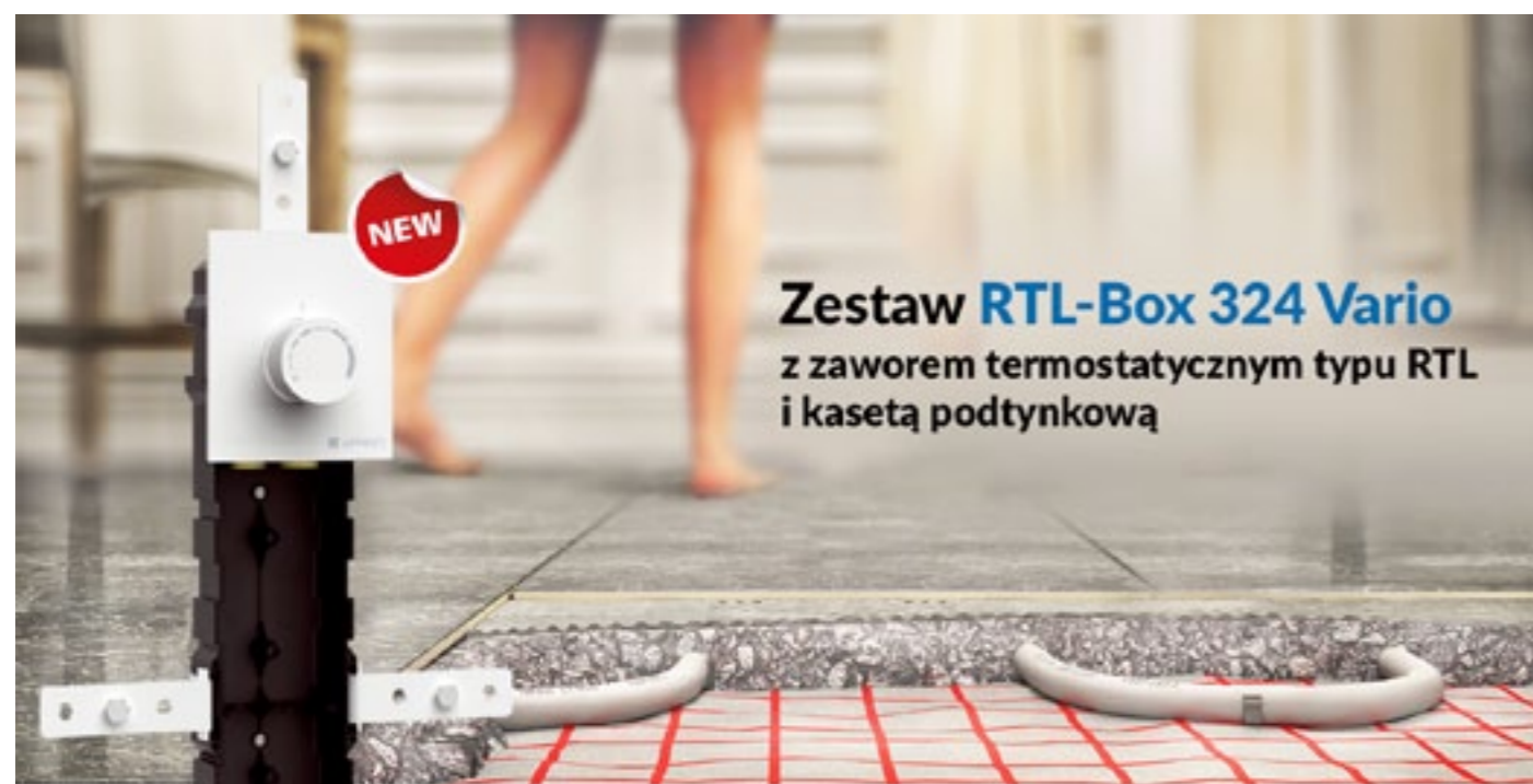
Zestaw RTL-Box 324 Vario z zaworem termostatycznym typu RTL i kasetą podtynkową

Jak regulować temperaturę w miejscach, które do tej pory były ogrzewane wyłącznie przez grzejnik i nie zrujnować wyglądu pomieszczenia skomplikowanym, trudnym w podłączeniu urządzeniem? Sprawdźcie nowość AFRISO: zestaw RTL-Box 324 Vario.