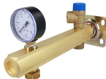
Rys. 1: Grupa bezpieczeństwa BSB

Grupa bezpieczeństwa przeznaczona jest do pracy w instalacjach w których stosować należy zawór bezpieczeństwa 6 bar, zbiornik c.w.u. nie jest większy niż 200 l, a moc instalacji nie przekracza 111,5 kW.