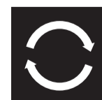
Rys. 3. Przycisk do sterowania pompą

Do wybrania pożądanej charakterystyki, służy przycisk znajdujący się w centralnej części panelu pompy: