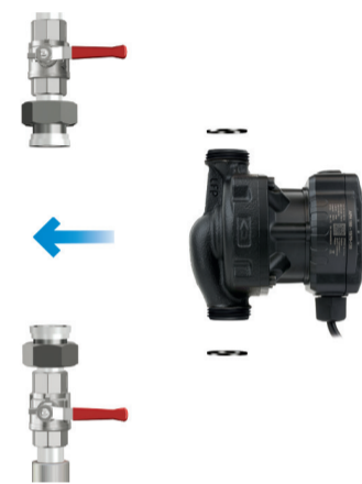
Rys. 2. Położenie zaworów odcinających względem pompy APH